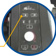
elektrische Einstellung d. Rollenabstandes