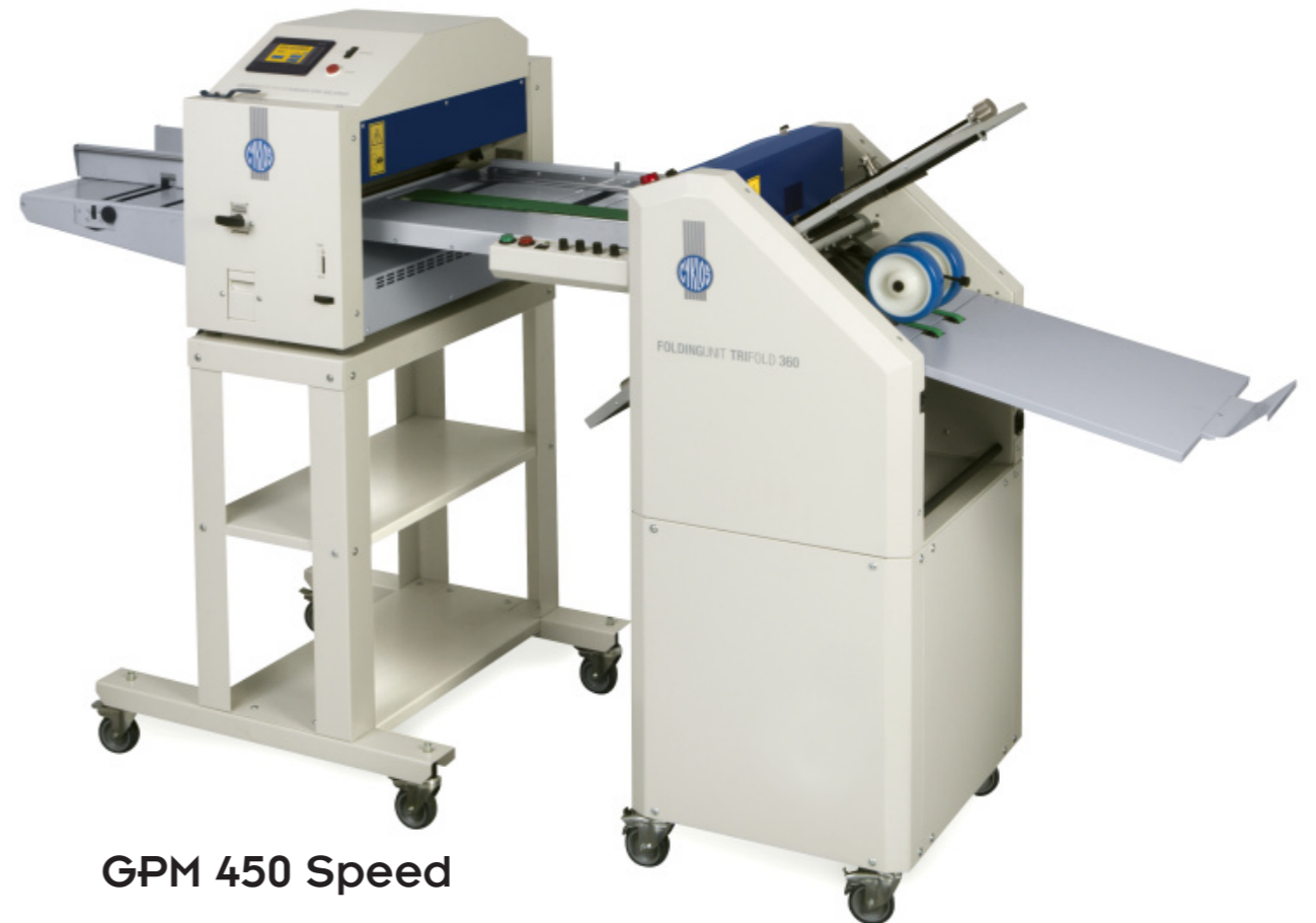
GPM 450 Speed